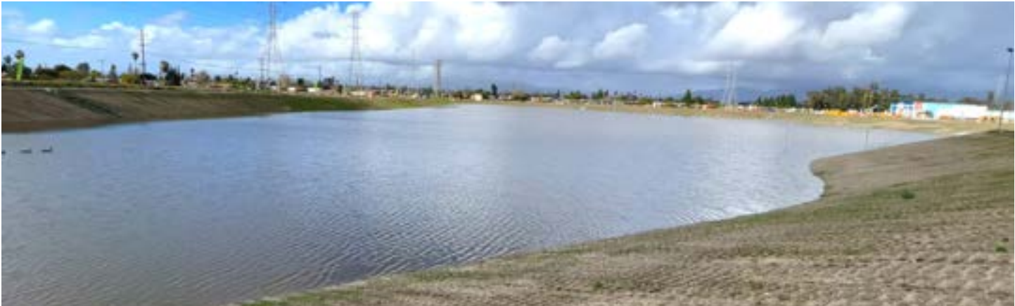
Se han capturado 45.59 mil millones de galones de agua de lluvia desde que la alcaldesa Bass asumió el cargo.

LADWP creó el Programa Integral de Reacondicionamientos Multifamiliares Asequibles (CAMR, por sus siglas en inglés) para apoyar a los propietarios de propiedades multifamiliares de bajos ingresos y a los residentes que desean instalar energía solar en los techos y aumentar la eficiencia energética. El programa CAMR ahora tiene más de 100 proyectos y 9,500 unidades de vivienda en proceso. Ante el calor extremo que se espera debido al cambio climático, el LADWP también relanzó el programa Cool LA. El mismo dirige los reembolsos para unidades de aire acondicionado de bajo consumo a los más necesitados (adultos mayores, familias con ingresos calificados y aquellos que viven en comunidades desatendidas) donde el calor extremo puede crear problemas de salud pública. En lo que va del 2023, el programa ha proporcionado a más de 7,000 clientes, que compraron 8,300 unidades de aire acondicionado, más de $2 millones en reembolsos.