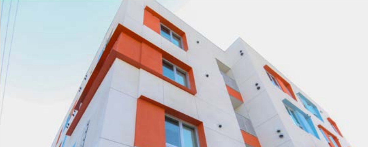
La gran inauguración de The Wilcox, un proyecto de vivienda de apoyo permanente acelerado por la Directiva Ejecutiva 1

Siguiendo el ejemplo de la alcaldesa, la Junta de Comisionados de Agua y Energía del LADWP ordenó al departamento que acelerara el proceso de aprobación para desarrollos de viviendas 100% asequibles. En la actualidad hay 242 proyectos en proceso acelerado de construcción y diseño; 42 proyectos con 2,404 unidades se han beneficiado de aprobaciones aceleradas; y 61 proyectos se han beneficiado del LADWP para cubrir los costos de la energía pública en el derecho de paso. Este programa ha ahorrado $22.8 millones para estos proyectos y ha reducido el cronograma de revisión del desarrollo, ingeniería y construcción de viviendas asequibles en un 85%. Los angelinos se están mudando a proyectos en todo Los Ángeles, como el Wilcox en Hollywood, meses antes de lo previsto, debido a la acción de la alcaldesa.