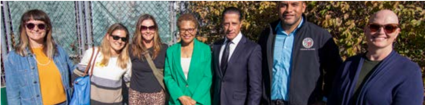
La alcaldesa Karen Bass con (I-D) el superintendente Alberto Carvhalo, el concejal Hugo Soto-Martínez y los padres de familia de Larchmont Charter School en Hollywood, destacando los éxitos de albergar a 41 personas que vivían en un campamento callejero al lado de la escuela.

La Ciudad actualmente tiene contratos con 39 moteles en Los Ángeles, agregando 923 habitaciones a la cartera de viviendas provisionales de la Ciudad. La Ciudad está tratando de extender el contrato de arrendamiento del LA Grand, reteniendo 481 unidades para viviendas provisionales, con servicios aumentados proporcionados por el Condado a través de una adjudicación del Fondo Estatal de Resolución de Campamentos. La Ciudad también completó dos proyectos de vivienda provisionales con un total de 233 camas y un sitio de estacionamiento seguro para 50 automóviles.